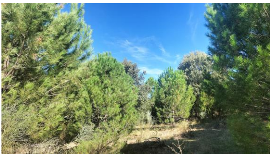
Forestación de pino piñonero y encina donde se van a realizar clareos y podas.

Durante este mes de Septiembre han dado comienzo las labores correspondientes de restauración con actuaciones diversas que incluyen clareos y podas en la forestación con pino piñonero y encina con el fin de mejorar la masa existente, injertos de pino silvestre sobre pino resinero; así mismo, se llevará a cabo una reforestación con encina y quejigo micorrizados con trufa negra.