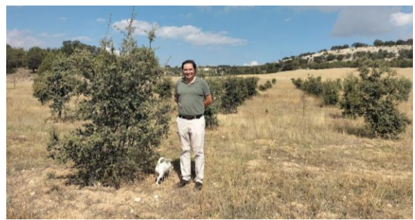
Reforestación de encina y quejigo micorrizados con trufa negra.

Ensayo de injertos de pino silvestre sobre pino resinero.