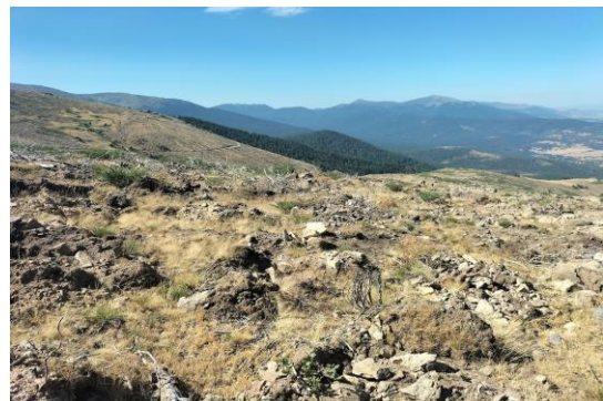
Control de densidad de ahoyado del expediente de restauración del incendio de La Granja (Real Sitio de San Ildefonso).