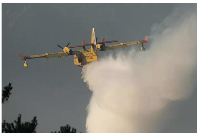
Asobim. El equipo de extinción de incendios trabaja en la extinción